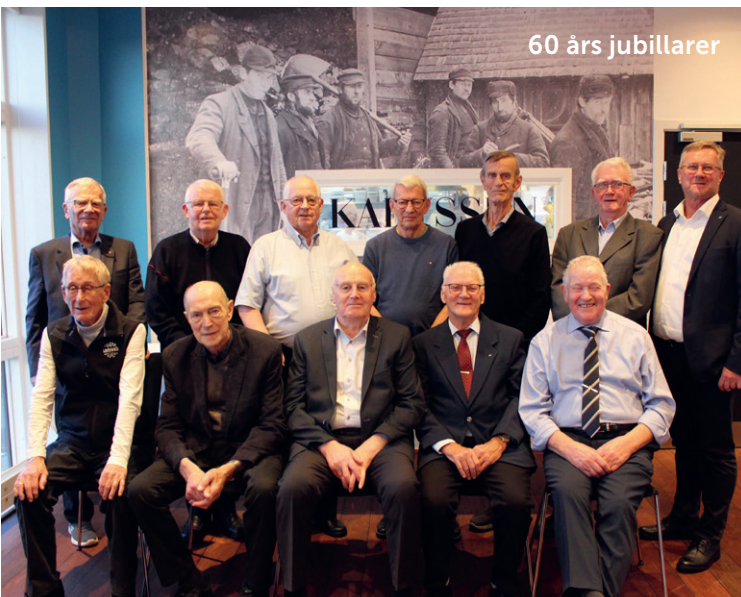
60 års jubilarer