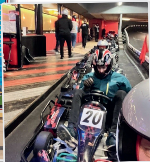
Generalforsamling i Metal Ungdom – Maj 2024