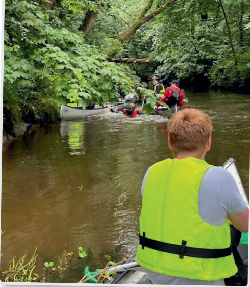
Metal Ungdom på kanotur – September 2024