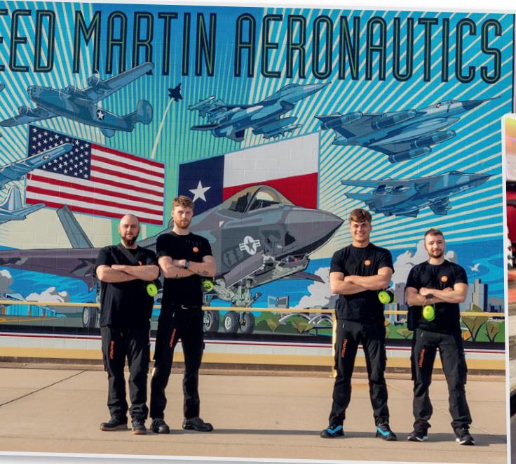
Dansk Metal leder efter fire industriteknikerlærlinge til praktik hos Lockheed Martin – September 2023