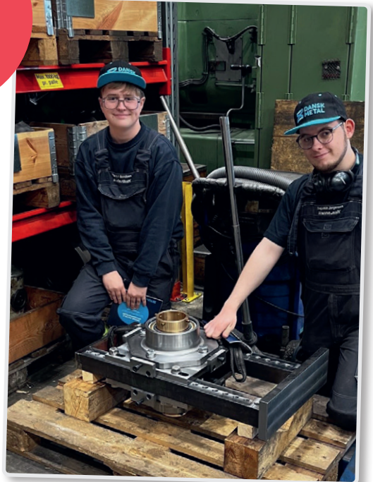
På besøg hos MarineShaft A/S i Hirtshals, hvor en lærling imponerede med et selvfremstillet værktøj – November 2025