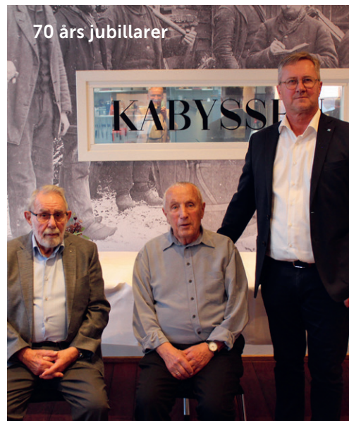
70 års jubilarer