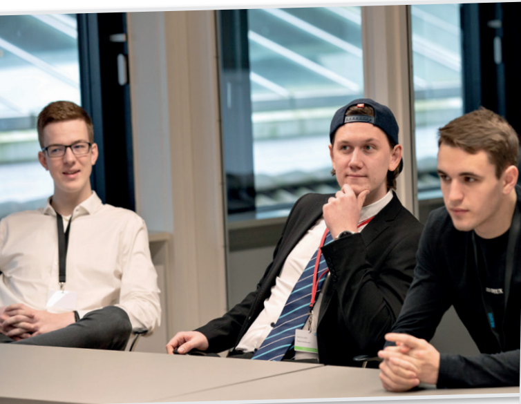
Lærlinge på Ungdomskursus på Metalskolen - Marts 2023

... på Ungdomsiderne i Metal Vendsyssel – dit lokale medlemsblad