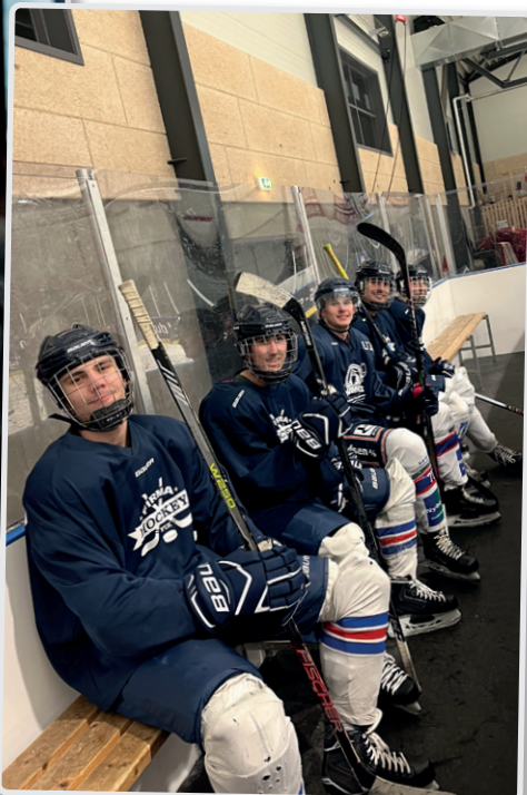
Metal Ungdom på glatis – Februar 2024