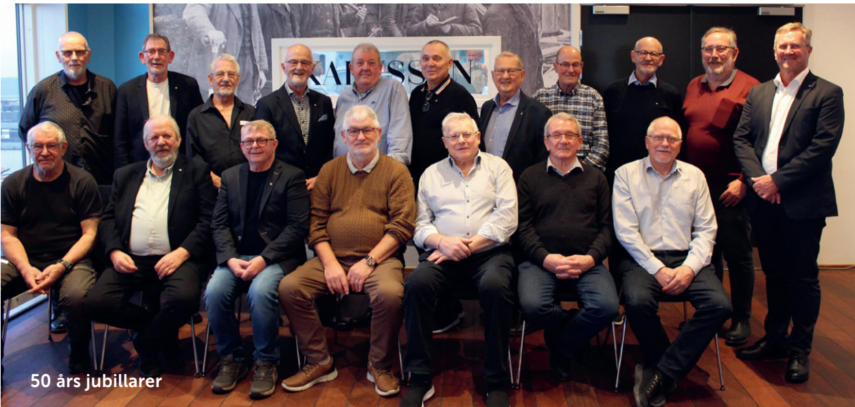
50 års jubilarer

Klik på billederne for at se dem i stor størrelse