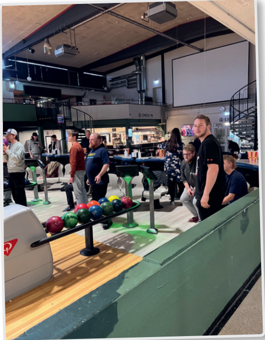
Lærlingearrangement – bowling og information om vejen fra folkeskolen til afdelingen – November 2024