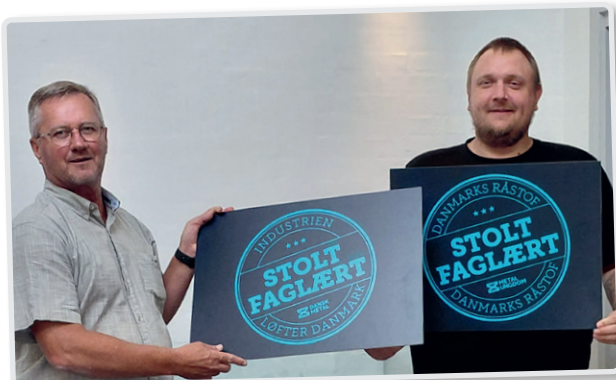
Lærlingekampagne fra uge 39 til 41 – September 2025